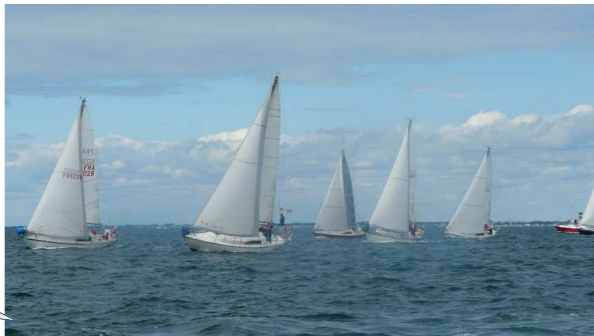
Les Arpège en baie après un second départ.