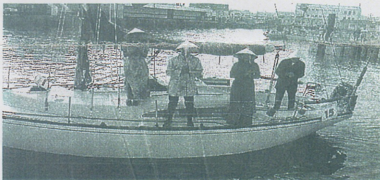
Un concours d'élégance dans le port a fait rire beaucoup de monde.

Le troisième jour, il y avait une surprise dans le port. Un concours d'élégance étonnait Islais comme touristes. Tout le monde pouvait admirer des Arpèges transformés en gondole, bateau corsaire, cirque, jonque tonkinoise ou encore bateau lavoir. Le prochain championnat se déroulera l'année prochaine à La Trinité-sur-Mer.