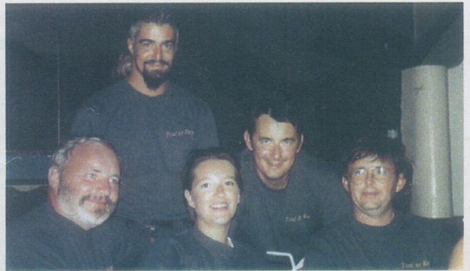
L'équipage du TOUL AR REOR vainqueur du championnat 97