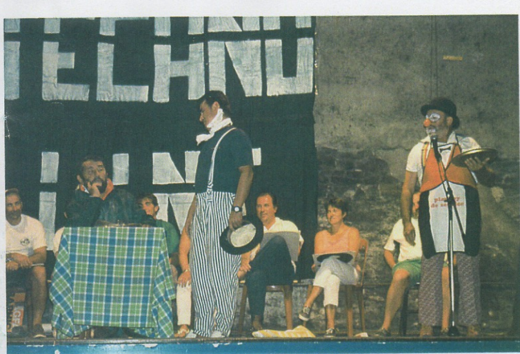
↑ ② "le restaurant" avec l'équipage du Toul ar Reor.