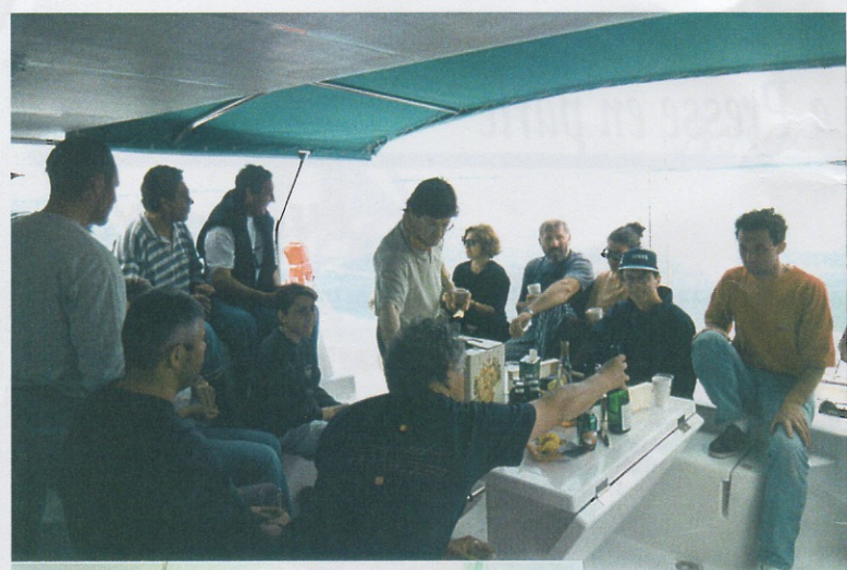
↑ ① Après l'effort le réconfort.