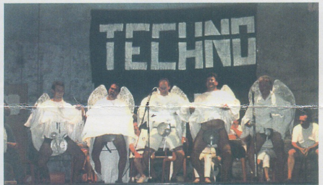
Les anges de DAVIKEN gagnent le concours des équipages